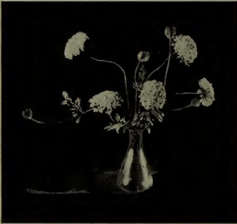
Didiscus cœrulea .